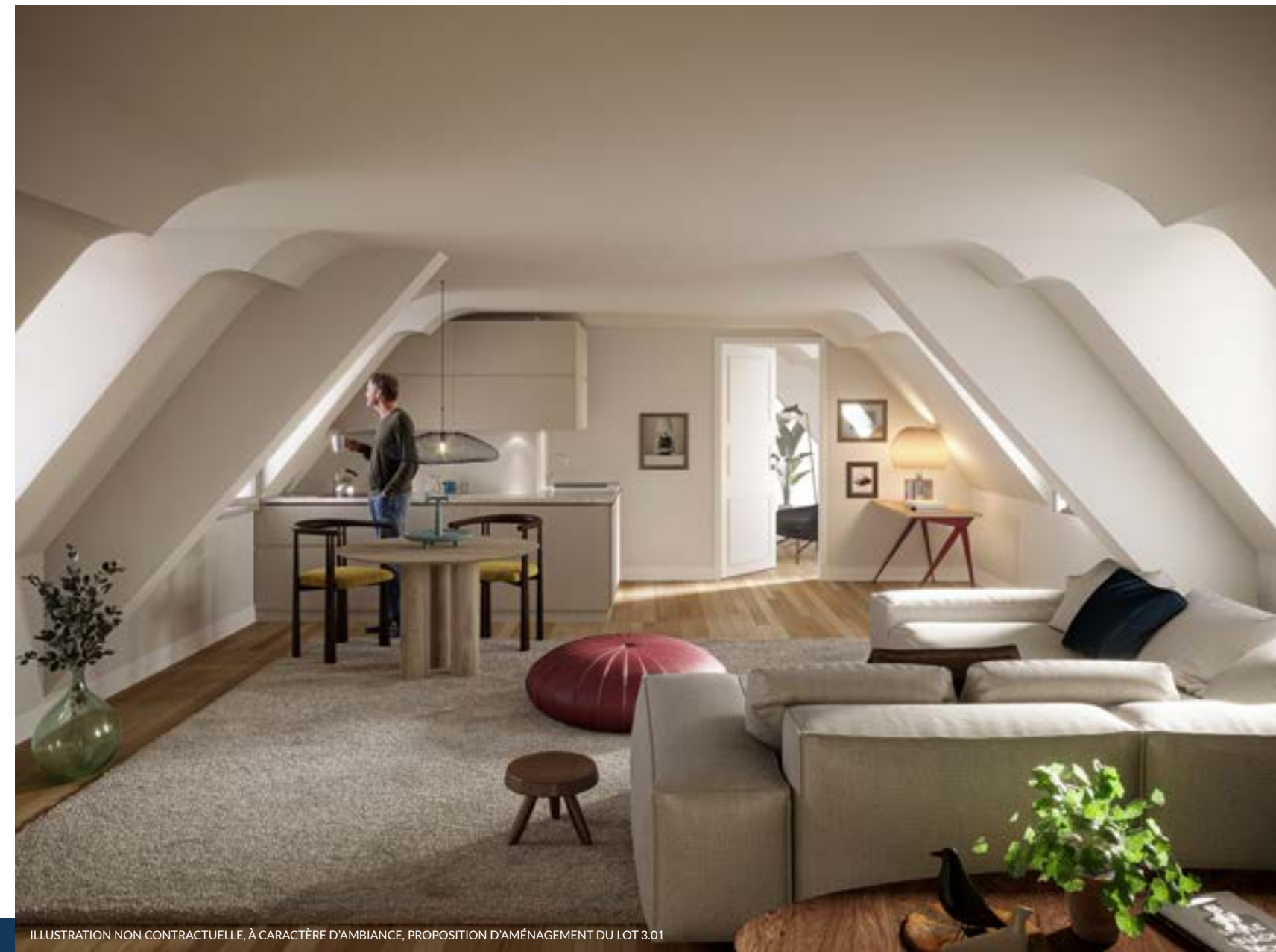
ILLUSTRATION NON CONTRACTUELLE, À CARACTÈRE D'AMBIANCE, PROPOSITION D'AMÉNAGEMENT DU LOT 3.01